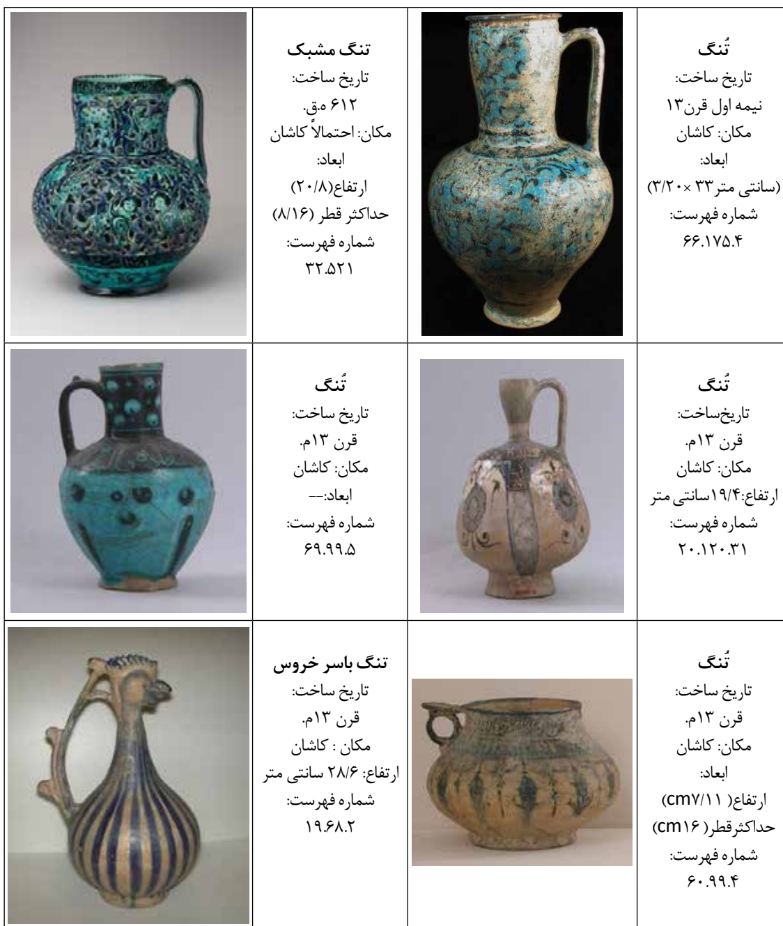
جدول ۱. مشخصات نمونه‌های مورد بررسی: تنگ‌های دوره سلجوقی (۶-۷ ه.ق.)، ساخت کاشان (ماخذ: نگارندگان)

ریچارد فرای می‌نویسد: «نخستین پدیده خاصی که در ذهن هر بازدید کننده نمایشگاه هنر ایران - به‌ویژه بازدیدکننده‌ای که بی‌درنگ پس از بازدید از آثار غرب، آثار ایرانی را دیده باشد - حاصل می‌شود، آن است که، هدف هنرمند ایرانی کاملاً متفاوت است. به جای آن که، نخست به آثار نقاشی نسبتاً بزرگ با شکل آدمیان بپردازد، در طی قرون متمادی، به زیبا ساختن و آرایش اشیا ویژه مورد استفاده و روزمره