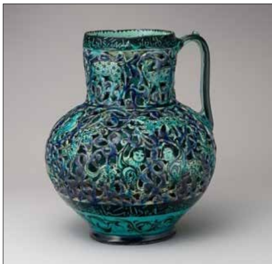
تصویر ۲: تنگ نمونه

گفتاری - که گفته‌پردازی برای گفته‌خوانی در زمان و مکان مشخصی ساخته و پرداخته است - در نظر می‌گیریم؛ و سعی می‌کنیم تا معنای پنهان آن را دریابیم. مشخصات نمونه: