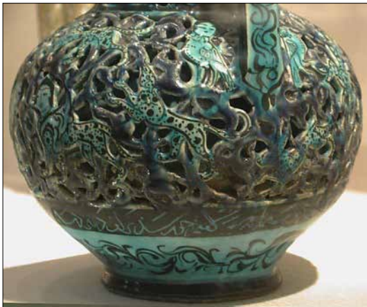
تصویر ۴: نقوش روی بدنه تنگ نمونه

عوض می‌شوند؛ و به این ترتیب، تحرک و جنب و جوشی دائمی، بین این قسمت به وجود می‌آید.