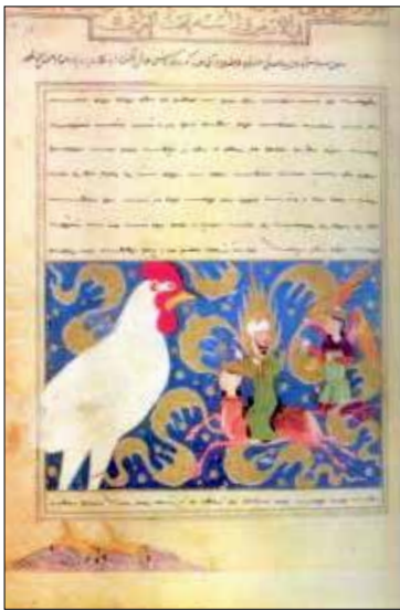
تصویر ۱۳. معراج نامه میر حیدر (سگای، ۱۳۸۵: ۹۰).