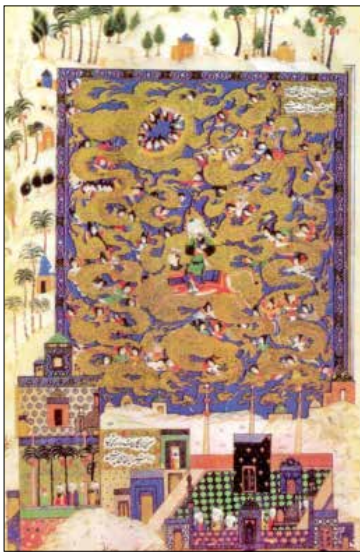
تصویر ۲۰. خمسه نظامی (آژند، ۱۳۸۹: ۵۲۹).