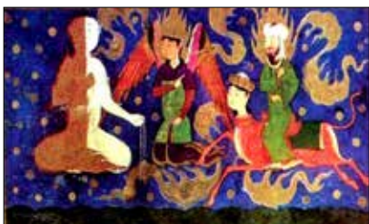
تصویر ۶. معراج نامه میر حیدر (تابعی، ۱۳۹۵: ۱۰۴).

ادوار و مکاتب بعدی، حذف شده و به مرور، از سده یازدهم هجری قمری، به شکل دوران بزرگ، در اطراف ران ظاهر گشته است (شین دشتگل، ۱۳۸۹: ۱۹۳). در معراج نامه احمد موسی (سده هشتم هجری)، ویژگی های مکتب ایلخانی در ترسیم چهره و پیکره حضرت محمد (ص) رعایت شده است. مساله مهم این که، در این نگاره، براق به تصویر کشیده نشده و پیامبر بر سر شانه های جبرئیل سوار است؛ در حالی که، از نظر تناسبات بصری، پیامبر کوتاه تر از جبرئیل و او که بار گران بهایی بر شانه دارد، به صورت عمودی و با شتاب در حال پرواز است. این تجسم از سفر روحانی پیامبر با هیچ یک از نسخه های تصویری معراج، در دوران های مختلف قابل مقایسه نیست (تصویر ۲).