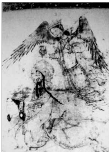
تصویر ۴. هفت اورنگ جامی (اولک گرابار، ۱۳۹۰: ۱۲۳).