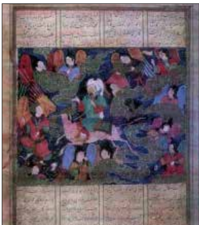
تصویر ۷. خاوران نامه (شین دشتگل، ۱۳۸۹: ۱۵۵).