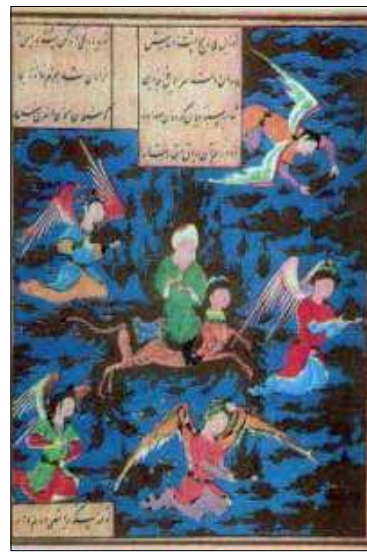
تصویر ۱۱. یوسف و زلیخای جامی (همان: ۱۷۰).

شاهرخی و خمسه نظامی دارای پاهای بلند و دمی دراز است (تصویر ۱). در نگاره‌ای از بوستان سعدی، تصویر براق با چهره زنانه، فربه، حالت پرواز و دم باریک و بلند، دارای کلاه و گردن‌بند و چهره سه رخ نقاشی شده است (تصویر ۹). با توجه به بررسی نگاره‌های معراج در این دوره، می‌توان گفت که، در رنگ لباس، کلاه و گردن‌بند براق تغییراتی به وجود آمده است. در همه موارد، چهره براق زنانه، بادمی بلند، اندامی اسب مانند و به صورت سه رخ، نگارگری شده است.