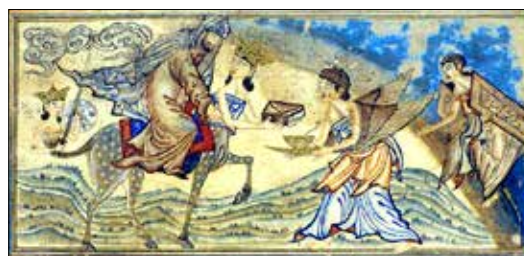
تصویر ۱. نزول قرآن کریم بر پیامبر (ص)، جوامع‌التواریخ (شین دشت گل، ۱۳۸۹: ۹۸).