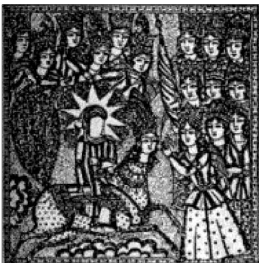
تصویر ۲۲. حمله حیدری (همان: ۲۲۲).