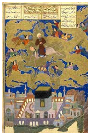
تصویر ۸. مخزن الاسرار نظامی (همان: ۱۵۹).

جدول ۳- مطالعه فرم براق در آثار نگارگری معراج در قرن ۹ و ۱۰ هجری قمری (دوره تیموری). (ماخذ: نگارندگان).