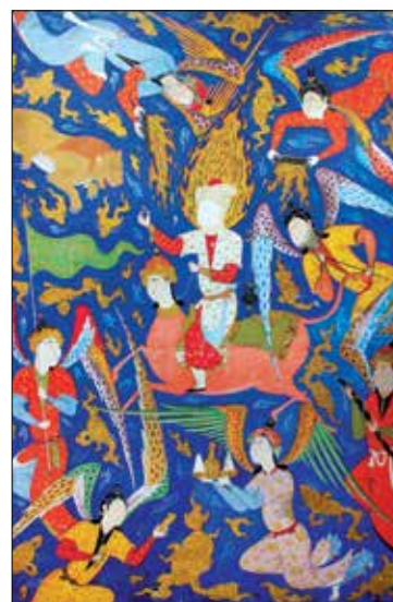
تصویر ۱۴. فال نامه شاه تهماسب (شین دشتگل، ۱۳۸۹: ۱۸۵).

بن بایسنغر تیموری شروع شد و در زمان سلطان خلیل آق قویونلو در شیراز ادامه یافت. پس از مرگ او، در سال ۸۸۳ هجری قمری، برادرش سلطان یعقوب آن را ادامه داد؛ دو تن از نقاشان دربار او، تصاویری بدان افزودند. بعدها که نسخه به دست شاه اسماعیل افتاد، دستور تکمیل آن را صادر کرد. لذا یازده نگاره دیگر بدان افزودند. غیر از سه نگاره از آن -که در مجموعه کی یر است- مابقی این نسخه در توپقاپی