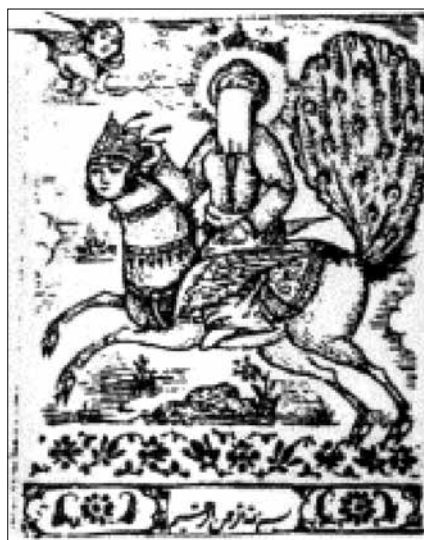
تصویر ۲۱. از کتاب داستان‌های عامیانه ضریر خزایی (شین دشتگل، ۱۳۸۹: ۲۲۱).

جدول ۵: مطالعه فرم براق در آثار نگارگری معراج قرن ۱۳ هجری قمری (دوره قاجار) (ماخذ: نگارندگان).