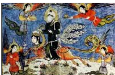
تصویر ۳. برگ الصاقی مرقع بهرام میرزا.

دارای زینی از یاقوت سرخ، فروریختن مروارید به جای عرق از سینه‌اش. بالش از طرف راست آویزان، تمام رنگ‌ها در آن موجود. در سرازیری‌ها، دست‌های او بلند و پاهایش کوتاه؛ در سربالایی‌ها حالتی برعکس. جانی چون آدمی داشته که، سخنان را شنیده و فهمیده و نسبت به آن، عکس‌العمل نشان داده است (نیشابوری، ۱۴۲۳: ۱۰۴). در روایاتی دیگر رسول خدا (ص) فرمود: خداوند نیز براق را مسخر من ساخت. آن عطا از همه دنیا بهتر و بالاتر و مرکبی از مراکب بهشت است که چهره‌اش همچون صورت آدمی و سم‌هایش چون سم اسبان و دمش مانند دم گاو است. رکابش از در سفید و آن را هفتاد هزار لگام از طلا است؛ دو بال دارد که با در و یاقوت و زبرجد تزیین و بر پیشانی‌اش این جمله نوشته شده است: «لَا إِلَهَ إِلَّا اللَّهُ وَحْدَهُ لَا شَرِيكَ لَهُ، محمد رسول الله» (طبرسی، ۱۳۸۱: ۱۰۳).