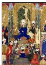
تصویر ۲. آزمون با سه پیاله با آب، شیر، شراب. معراج‌نامه احمد موسی (همان: ۱۰۵)