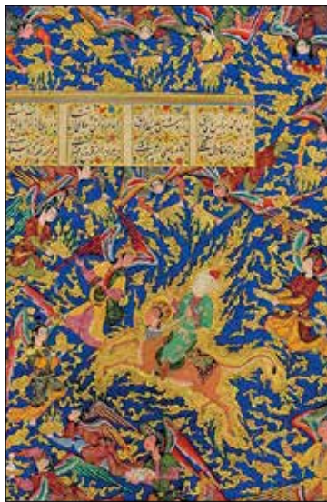
تصویر ۱۲. هفت پیکر نظامی (همان: ۱۷۵).