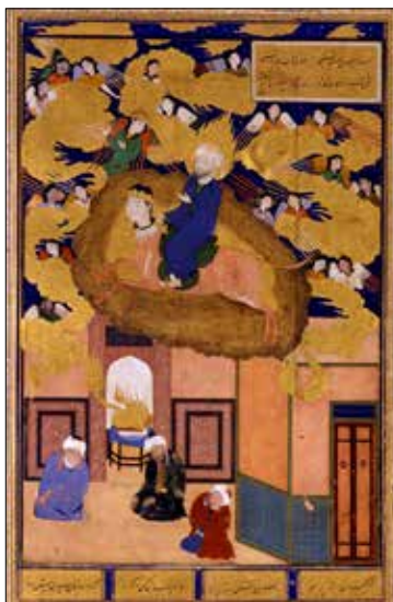
تصویر ۹. بوستان سعدی (همان: ۱۶۴).