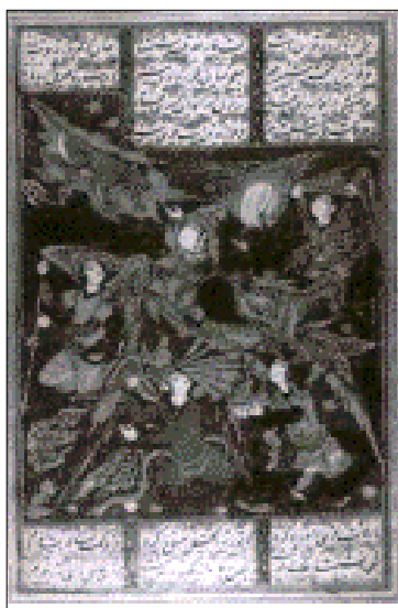
تصویر ۱۶. معراج نامه (همان: ۷۶).