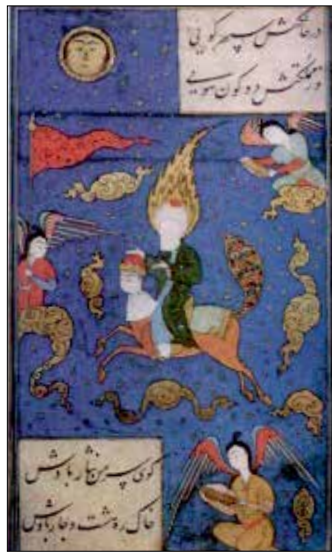
تصویر ۱۹. گوی و چوگان، مولانا محمود عارفی (همان: ۱۶۸).