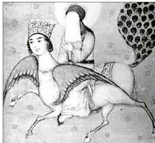
تصویر ۱۸. نقاشی منابع ترکی (همان: ۷۹).

از عناصری که تصویرگران دوره قاجار بر پیکر براق افزودند، دمى شبیه به طاووس بود (تصویر ۲۱). اگر چه در روایات، هیچ اشاره ای به چنین دمى نشده است، اما شاید آن را در زمره